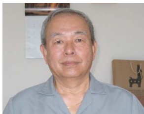
清 好延 氏